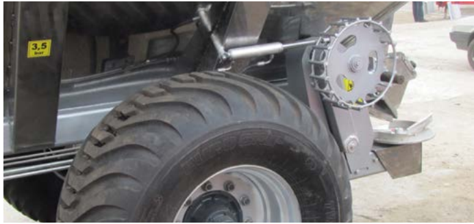
Привод от колеса