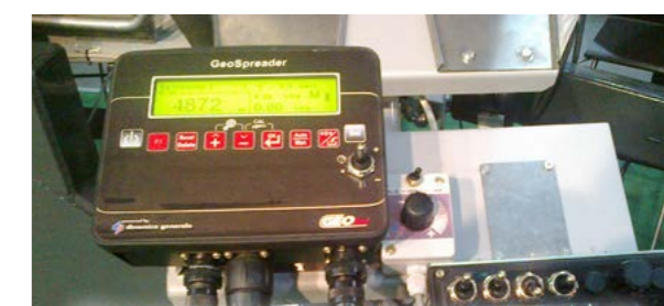
Компьютер для точного внесения удобрений