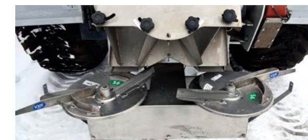
Нержавеющие тарелки с гидроприводом – ширина внесения 24 (36) м